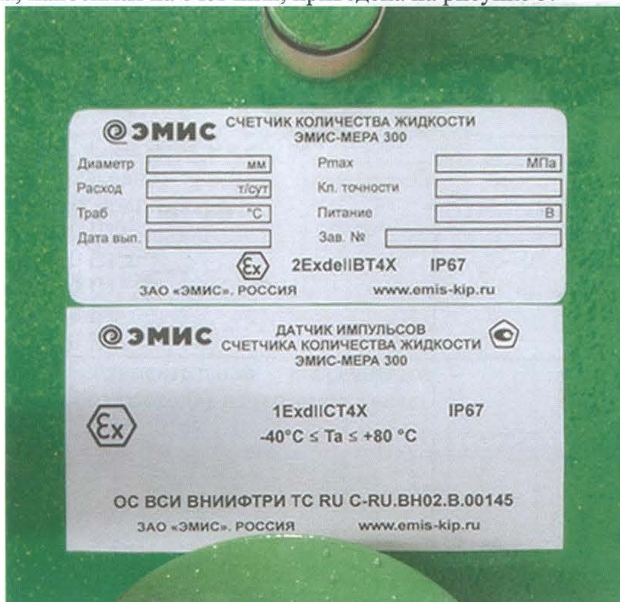
Рисунок 5 - Маркировка, наносимая на корпус счетчиков

Маркировка, наносимая на счетчики, приведена на рисунке 5.