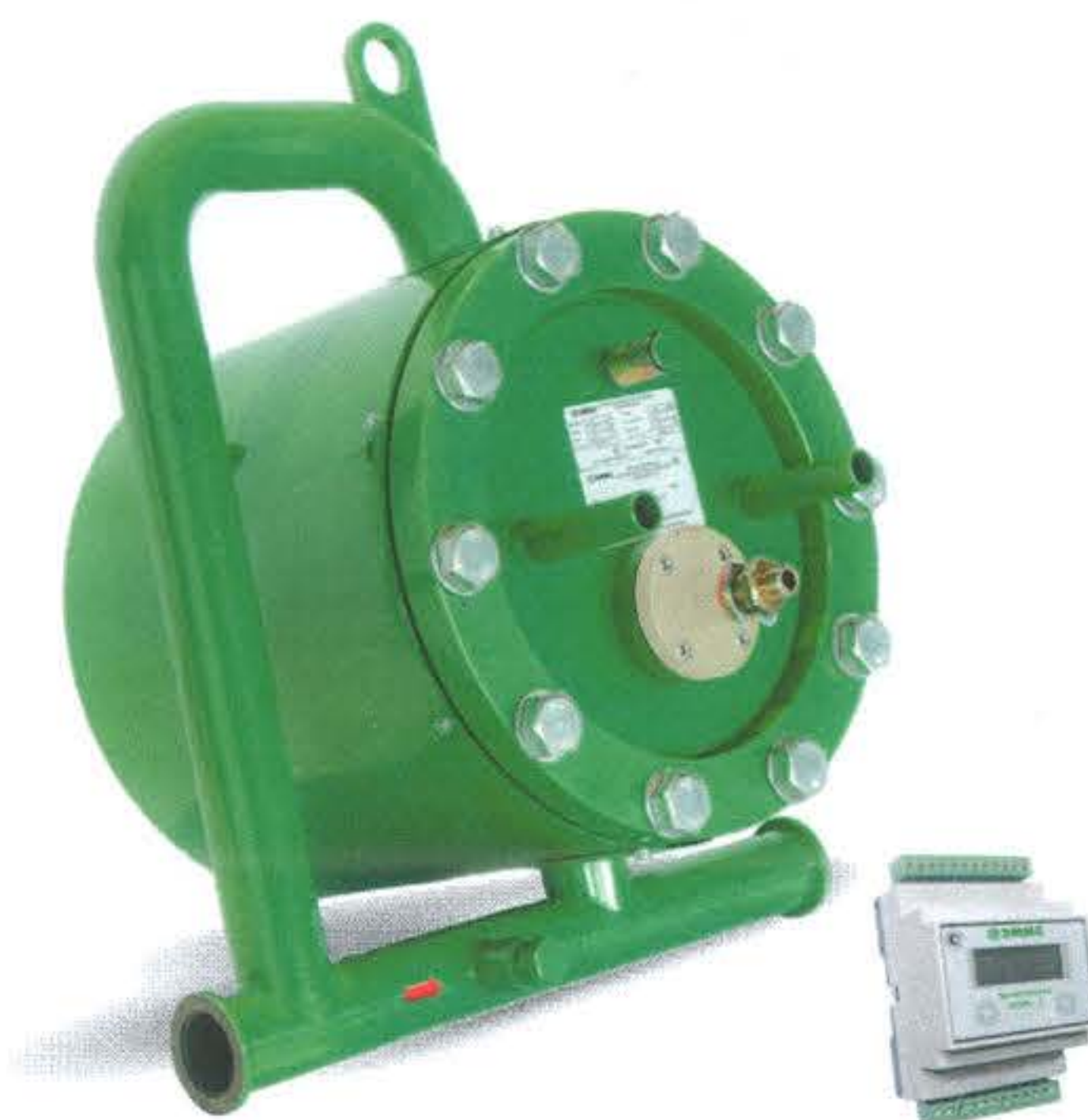
Рисунок 2 - Общий вид счетчиков раздельного исполнения