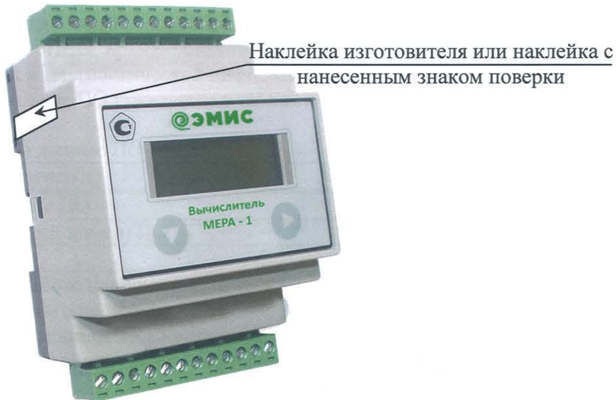
Рисунок 4 - Схема пломбировки вычислителя счетчиков раздельного исполнения