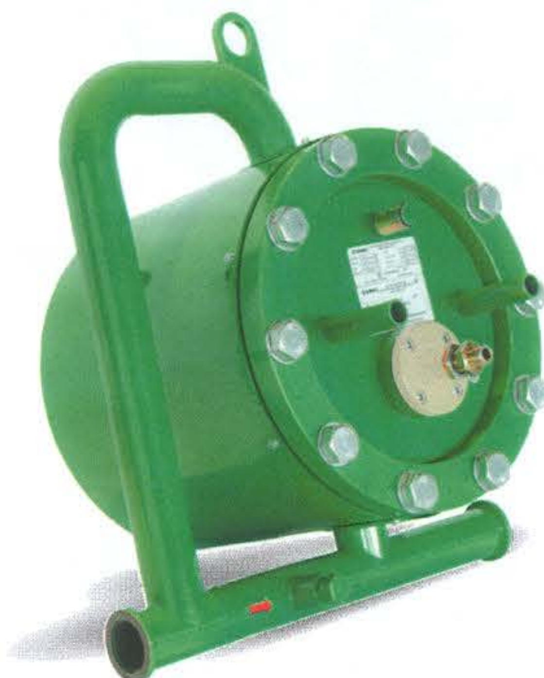
Рисунок 1 - Общий вид счетчиков моноблочного исполнения

Общий вид счетчиков приведен на рисунках 1-2.